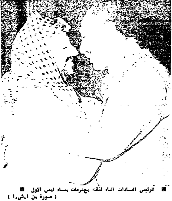
الرئيس السادات اثناء لقائه مع عرفات مساء امس الاول (صورة من ا.ش.ا)